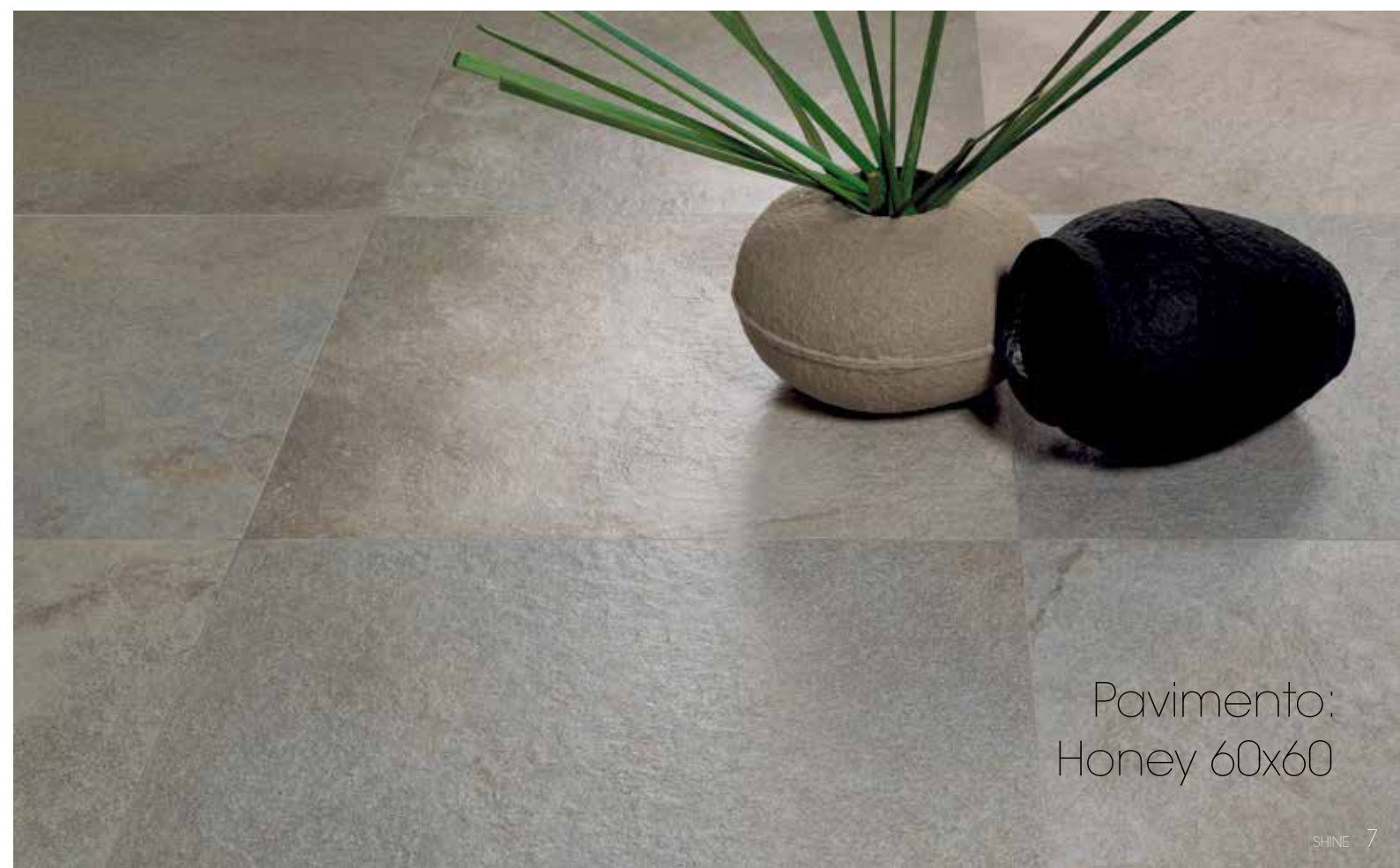
Pavimento: Honey 60x60