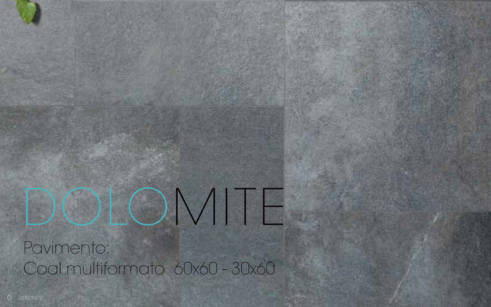
Pavimento: Coal multiformato 60x60 - 30x60