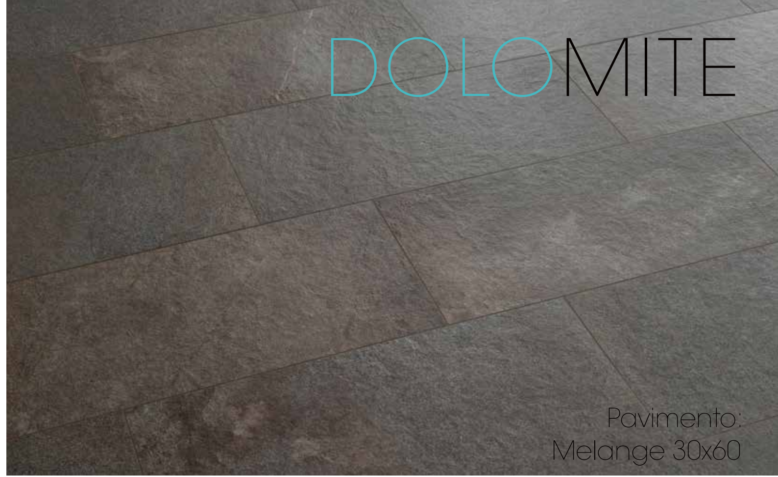
Pavimento: Melange 30x60